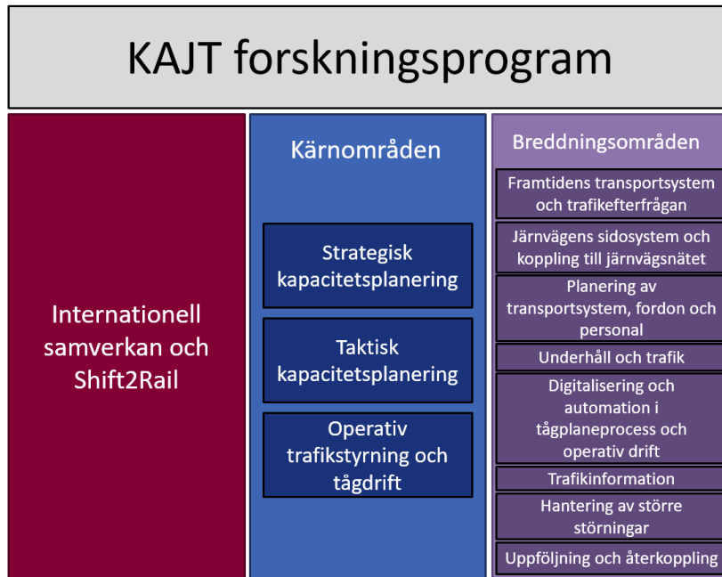
Figur 1: KAJT Forskningsprogram

Kärnområden definierar branschprogrammets primära forskningsområde. Inom kärnområdet är det parterna i KAJT som är Sveriges primära forskningsutövare. Deltagarna i branschprogrammet har tillsammans ledande kompetens för att bedriva forskning inom området. KAJT:s tre kärnområden är: