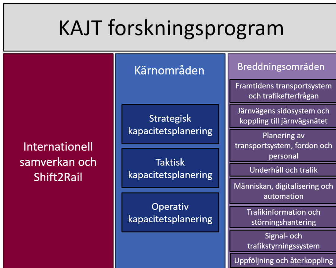
Figur 1: KAJT Forskningsprogram

KAJT:s forskningsprogram består av tre (delvis överlappande) huvudkomponenter: Internationell samverkan och Shift2Rail, Kärnområden och Breddningsområden, vilket illustreras i Figur 1.